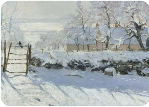
TABLEAU N°5 LA PIE - DE CLAUDE MONET